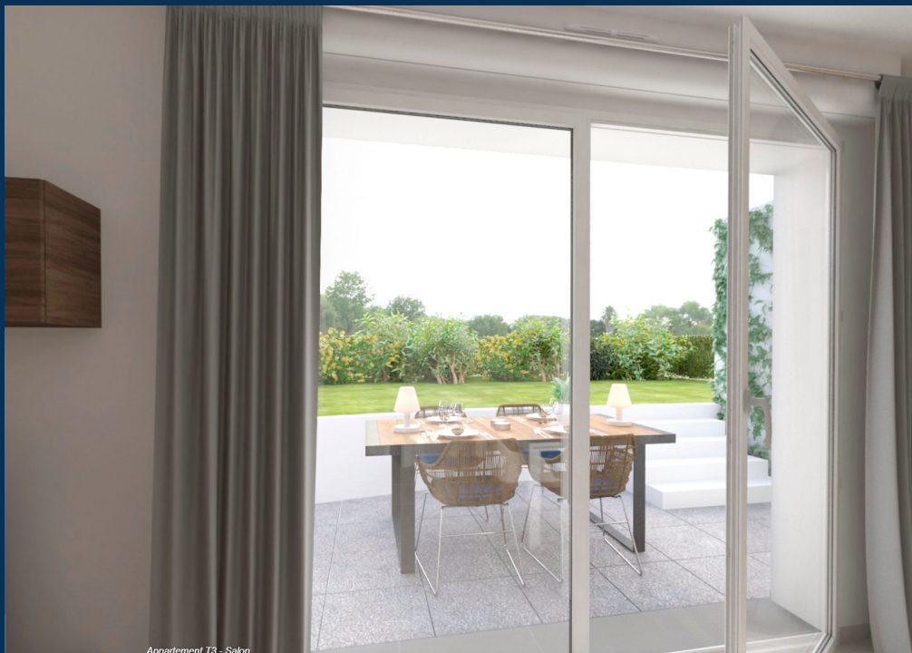
Appartement T3 - Salon